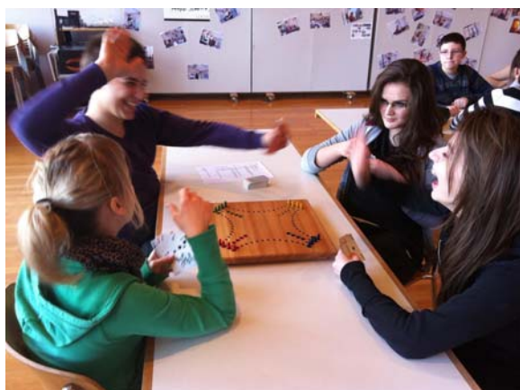
Give me five - wie das Spiel wohl enden wird?

Am Nachmittag lernten die Schüler und Schülerinnen das Spiel "Dog" kennen.