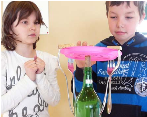
Wird das Experiment wohl gelingen?