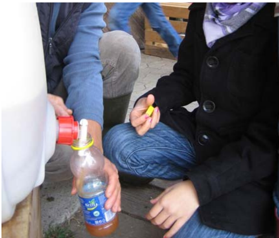
Eine nicht alltägliche Leckerei - frisch gepresster Apfelsaft.