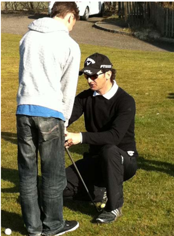
Professionelle Hilfe ist nötig.

Echter Erlen Golf wird auf einem Golfplatz gespielt, der 18 Spielbahnen (auch 18 Löcher genannt) aufweist. Wichtig für die Schüler war natürlich auch die richtige Körperhaltung zu erlernen, aber auch einiges über die einzelnen Golfschläger zu erfahren und diese richtig anzuwenden, damit der Golfball auch richtig weit durch die Lüfte fliegen konnte. Gemäss den aktuellen Golfregeln können bis zu 14 Schläger vom Spieler auf eine Golfrunde mitgenommen werden.