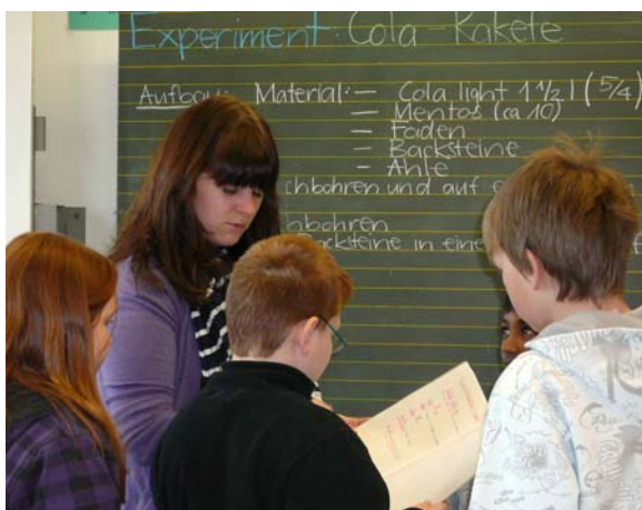
Kurze Einführung vor dem Experiment.

Auch wurde den Schülern mitgeteilt, dass am Schluss der Woche eine Ausstellung von den Experimenten geplant war. Nach dieser Einführung arbeiteten die Schüler in den vorgängig besprochenen Teams mehrheitlich selbstständig.