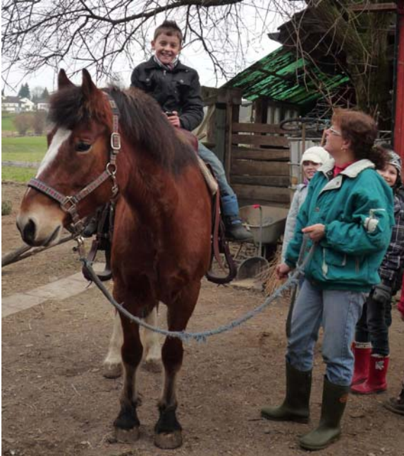
Auf dem Rücken der Pferde.....

Um wirklich einen Einblick in das Leben und das Arbeiten auf einem Bauernhof zu erhalten, besuchten wir in Abständen von ein bis drei Monaten fünfmal den Hof der Familie Ottiger in Riedt.