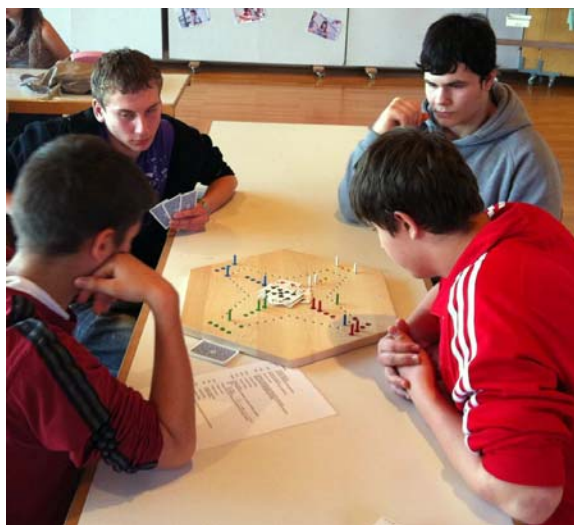
Strategie und List sind bei "Dog" gefragt.

Das ist ein Karten- und Brettspiel, bei dem es ähnlich dem "Eile mit Weile" darum geht, seine Figuren möglichst rasch ins Ziel zu bringen. Erschwerend und interessanterweise kommt aber dazu, dass man es zusammen mit einem Partner spielt, dass es wesentlich reicher an möglichen Spielzügen und Varianten ist und auch mit Strategie und List gespielt werden kann.