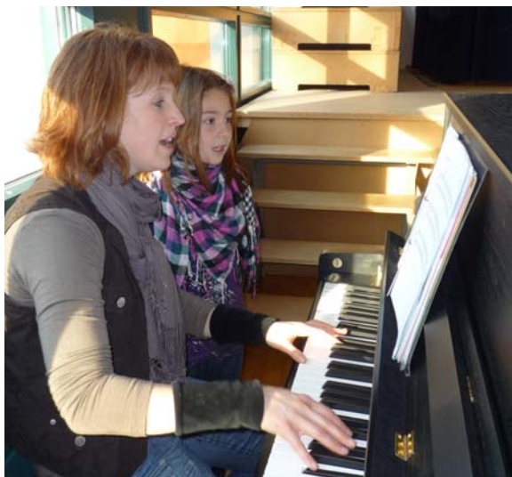
Auch "Heidis"-Solo wird sorgfältig geübt.

Alle Erst- und Zweitklässler übten intensiv die vielen Lieder möglichst rein und deutlich zu singen. Mit Geduld und Ausdauer lernten die Theaterspielerinnen und Theaterspieler laut, deutlich und gut betont zu sprechen. Auch etwas Gestik musste erarbeitet werden und in den einzelnen Szenen möglichst natürlich wirken. Ohne Konzentration ging es nicht.