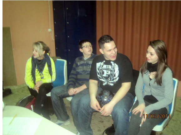
Wer wird wohl gewinnen?

Den Mädchen war dieses ganze Theater um die Bowlingkugel egal, sie hatten auch so ihren Spass am Spiel und überlegten auch einmal privat ins "1001" zu kommen.