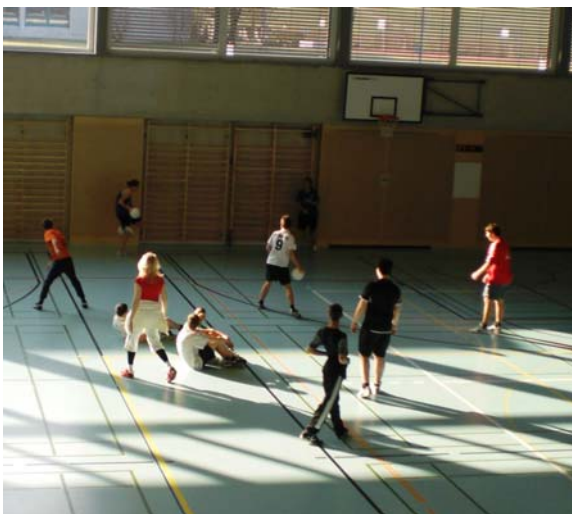
Aufwärmen beim Völkerball

Die beiden Gruppen in der Halle wärmten sich mit diversen Balanceübungen mit Schläger und Federball auf. Danach folgte eine vereinfachte Form des amerikanischen Völkerballs. Bei dieser Variante spielen zwei Teams gegeneinander mit dem Ziel, die Spieler der gegnerischen Mannschaft mit dem Ball zu treffen, so dass sie der Reihe nach ausgeschaltet werden. Gefragt sind Gewandtheit, Treff- und Fangsicherheit, Ausdauer und Geschwindigkeit.