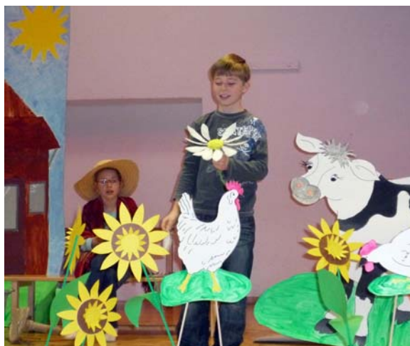
Solosänger "Seppli" in Aktion

Nun konnte es aber wirklich losgehen! Die Rollen wurden verteilt und auswendig gelernt. Solosängerinnen und Solosänger übten einzeln ihre Strophen.