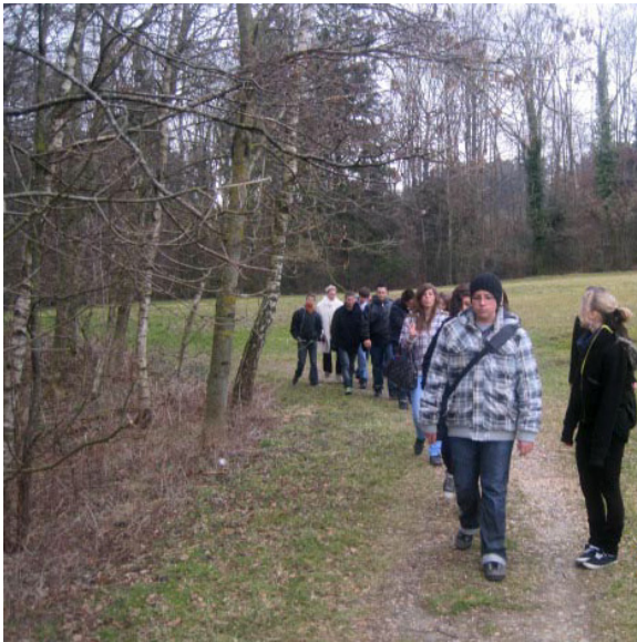
Marsch um den Biessenhofer-Weiher