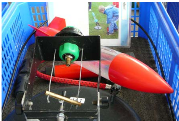
Das Experiment Rockyman (Wasserrakete) war sehr beliebt.

Flaschenzug, Spiralscheibe und "18 Nägel auf einem Kopf"