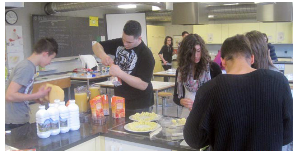
Emsiges Treiben in der Schulküche!

In der Schulküche ging es dann wieder schnell zur Sache. Hygiene und Verhalten wurden kurz angesprochen, Aufgaben und Lebensmittel verteilt. Mit Routine machten sich die Schüler an die Arbeit, so dass wir innerhalb kürzester Zeit vier schön gedeckte Tische vorfanden.