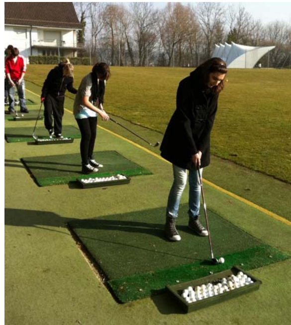
Übung macht den Meister!

Die Schläger unterscheiden sich durch die Länge des Schafts (beim Golf gemessen in Zoll), Loft, Bauform und Material. Grundsätzlich wird die Flugbahn des Balls durch den Loft und die Schaftlänge gesteuert, je mehr Loft, desto höher und kürzer die Flugbahn; je länger der Schläger, desto stärker kann er beschleunigt werden und desto weiter fliegt der Golfball.