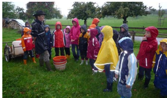
Auch bei schlechtem Wetter muss auf dem Bauernhof angepackt werden!

Alle durften drei grosse, schöne Äpfel fachmännisch pflücken und behutsam mit in die Schule nehmen. Dort verarbeiteten wir sie zu getrockneten Apfelingen weiter. Wir lernten auch verschiedene Apfelsorten kennen. Jede Klasse erkor, nach ausgiebigem Probieren, ihre Liebessorte zur "Apfelkönigin".